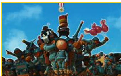
● La Détente de Bertrand Bey Pierre Ducos France / 2011 / 8 min''

Cette programmation 14-18 est née d'une envie commune de trois festivals d'animation, Anima Bruxelles, le Festival international du film d'animation d'Annecy et Internationales Trickfilm-Festival Stuttgart d'honorer chacun à leur manière toutes les victimes de cette guerre.