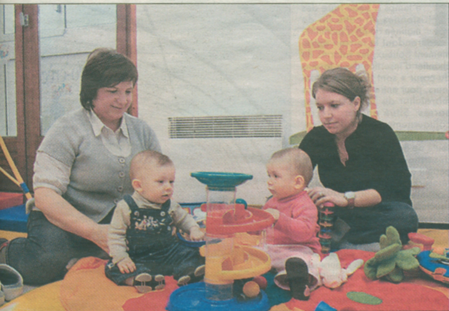
crèches, auparavant compétence des municipalités, passent dans le giron de l'agglomération Brive (photo d'illustration).

munautaire de l'année, parmi les nombreux sujets abordés, transfert de compétence de la petite enfance à l'agglomération.