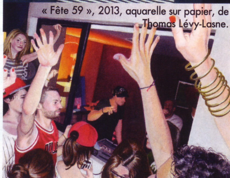
« Fête 59 », 2013, aquarelle sur papier, de Thomas Lévy-Lasne.

* Prochaine exposition au Salon du dessin contemporain Drawing Now, Paris-3*. Du 26 au 30 mars.