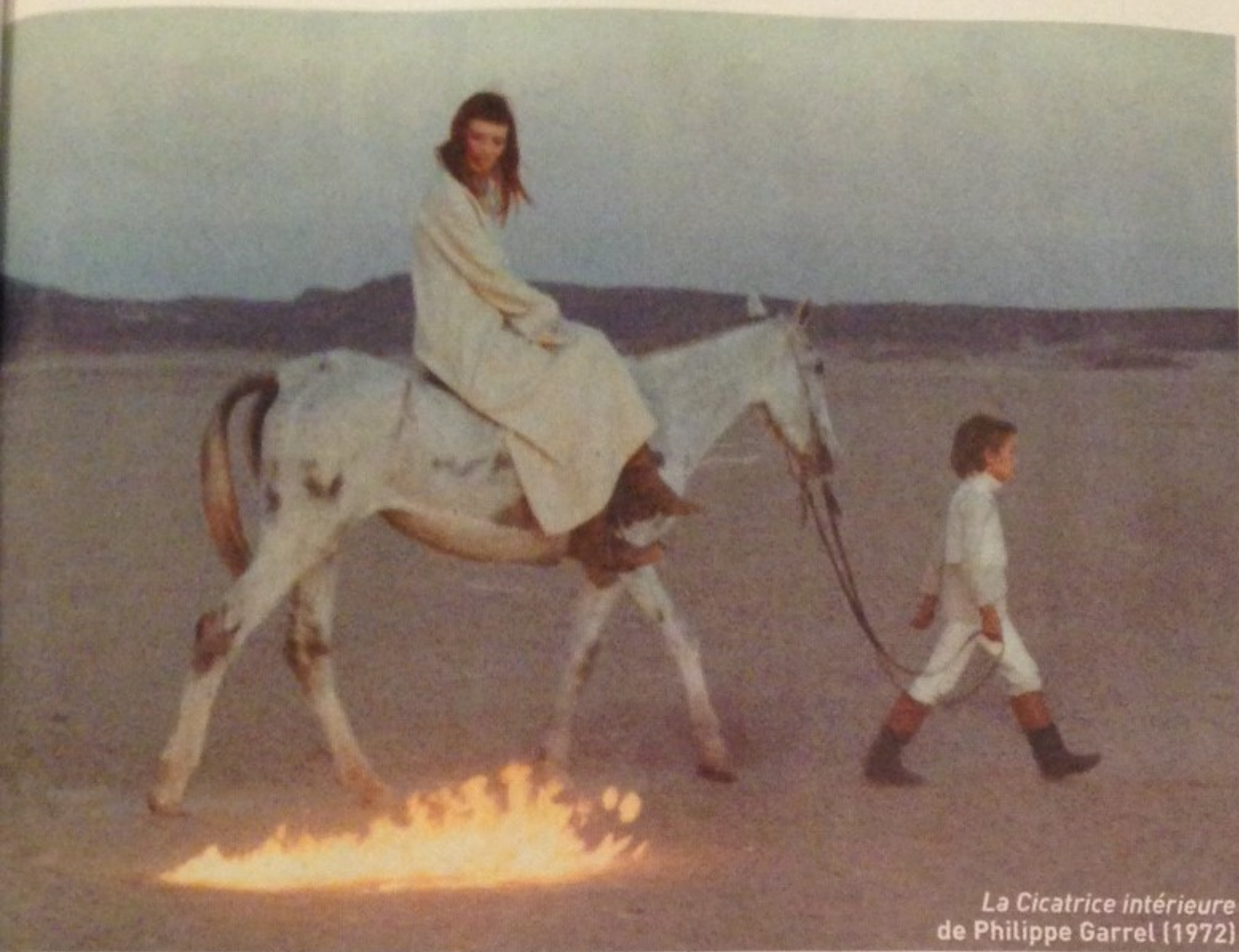
La Cicatrice intérieure de Philippe Garrel (1972)