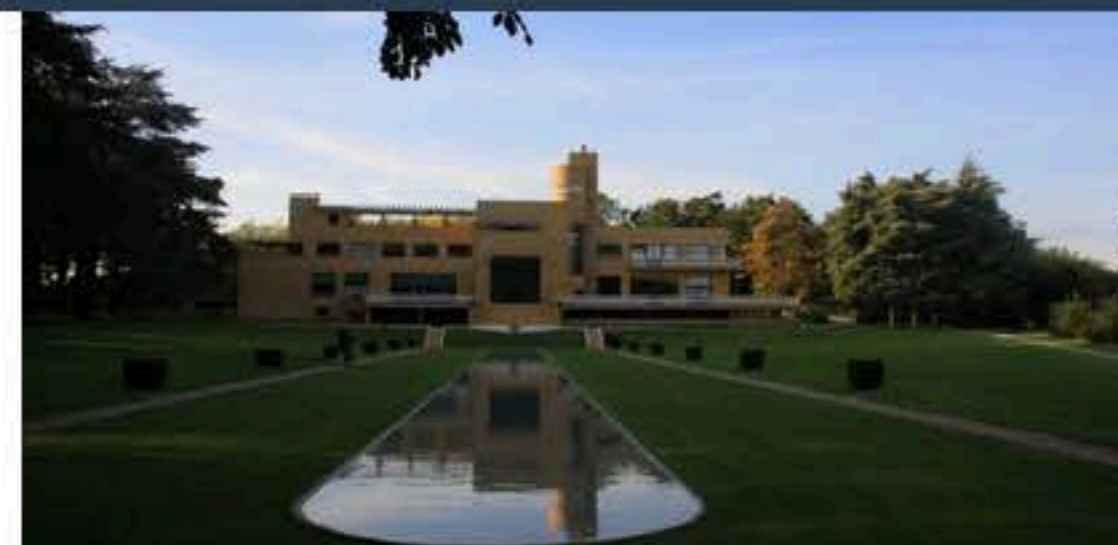
LA VILLA CAVROIS EN ÉTAT DE SIÈGE